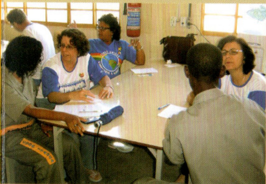
Campanha em São Gonçalo - Itaóca

As principais atividades desenvolvidas são: