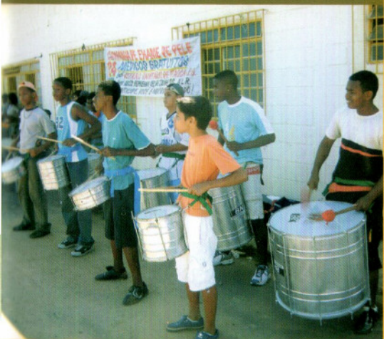
Campanha em São Gonçalo - Itaóca

A Associação NLR Brasil é uma organização não-governamental beneficente, de caráter filantrópico, mantida pela ONG holandesa Netherlands Leprosy Relief (NLR), atuante no combate à hanseníase no Brasil desde 1994, atualmente com sede na cidade do Rio de Janeiro.