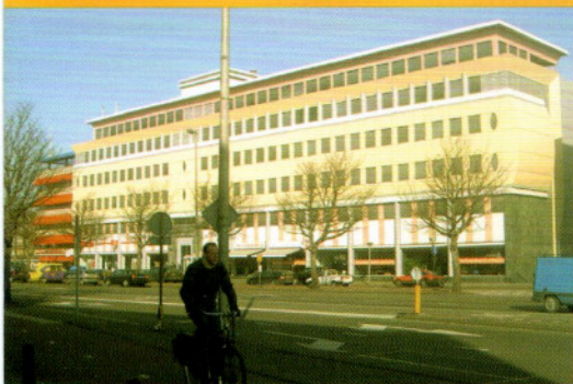
Sede NLR Holanda