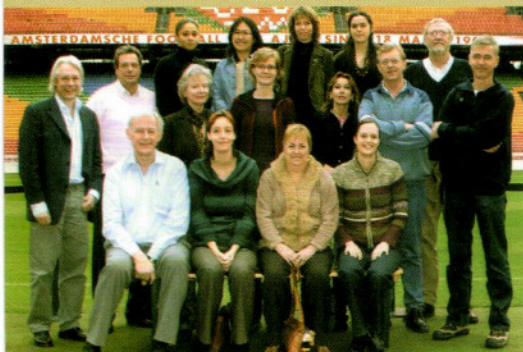
Equipe NLR Holanda

A NLR – Netherlands Leprosy Relief é uma organização não-governamental holandesa, fundada em 1967. É membro da ILEP – International Federation of Anti-Leprosy Associations, instituição que disponibiliza em seu site ( www.ilep.org.uk ) artigos em português voltados para a luta contra a hanseníase.