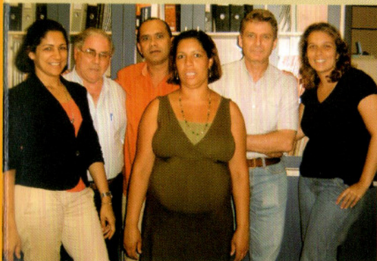
Equipe NLR Brasil