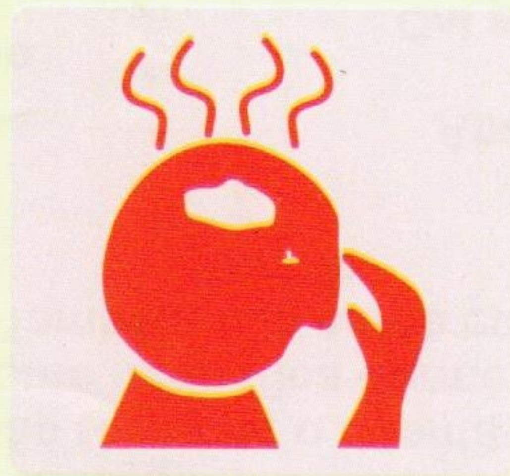
Febre baixa geralmente à tarde