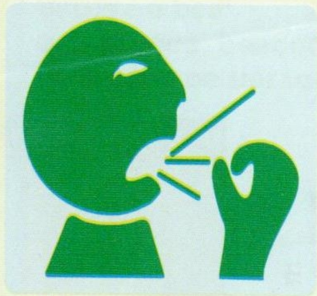
Tosse e escarro por mais de três semanas

Ao apresentar alguns desses sintomas, procure imediatamente um Posto de Saúde mais próximo de sua casa.