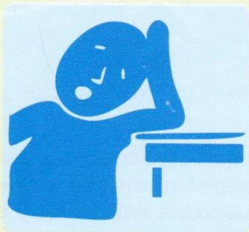
Cansaço fácil, falta de apetite, dor no peito